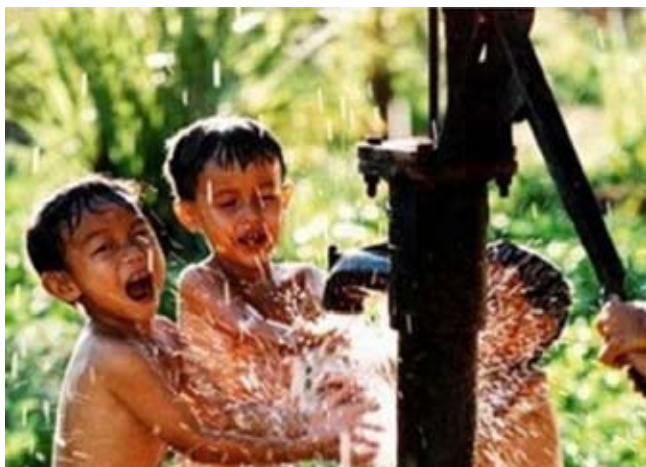
Nhờ chương trình Mục tiêu Quốc gia về Nước sạch và Vệ sinh Môi trường Nông thôn 1,7 triệu người sẽ được sử dụng nước sạch

B an Giám đốc Điều hành của Ngân hàng Thế giới hôm nay đã thông qua khoản tín dụng IDA trị giá 200 triệu USD hỗ trợ chương trình Mục tiêu Quốc gia về Nước sạch và Vệ sinh Môi trường Nông thôn.