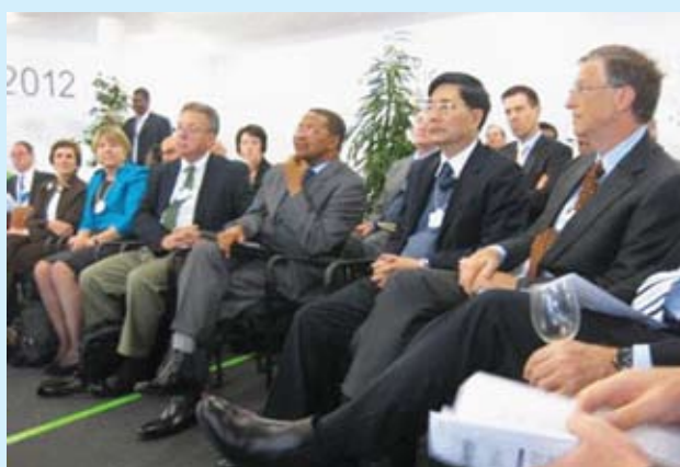
Bộ trưởng Cao Đức Phát trong phiên họp Tầm nhìn mới cho nông nghiệp tại Davos, Thụy Sĩ 2012

Cách đây vài năm, tại Diễn đàn Kinh tế Thế giới hợp thường niên tại Davos, một sáng kiến quan trọng được đưa ra lấy tên là “Tầm nhìn mới trong nông nghiệp” với sự tham gia của nhiều tập đoàn đa quốc gia và nhiều tổ chức phát triển của thế giới. Mục tiêu của sáng kiến này có thể tóm tắt là: trong 10 năm, cố gắng tăng sản lượng nông nghiệp lên 20% trong khi giảm 20% tỷ lệ đói nghèo và giảm 20% mức phát thải carbon.