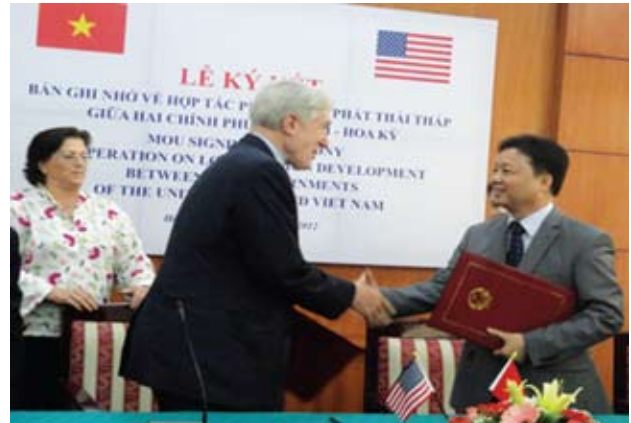
Thứ trưởng Bộ Tài nguyên Môi trường Trần Hồng Hà và Thứ trưởng Ngoại giao Mỹ Robert D. Hormats

Bản ghi nhớ sẽ mở ra nhiều cơ hội hợp tác, trao đổi kinh nghiệm giữa hai bên; trong đó có hợp tác kiểm kê khí nhà kính quốc gia; góp phần xây dựng các mô hình phát thải trong nông nghiệp, lâm nghiệp, sử dụng đất; góp phần xây dựng mô hình phát triển cho lĩnh vực năng lượng, công nghiệp, giao thông vận tải.