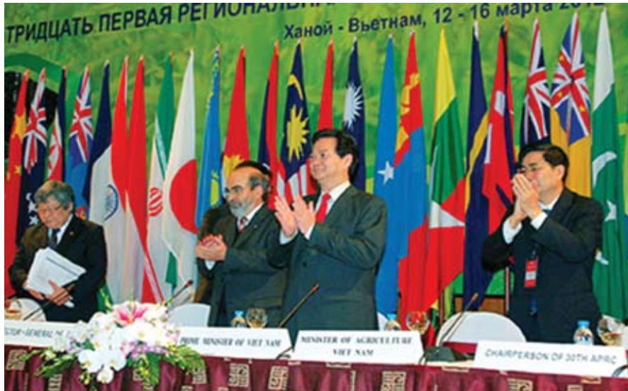
Thủ tướng Chính phủ Nguyễn Tấn Dũng dự khai mạc phiên toàn thể Hội nghị FAO khu vực châu Á - Thái Bình Dương lần thứ 31 được tổ chức tại Hà Nội ngày 15/3/2012