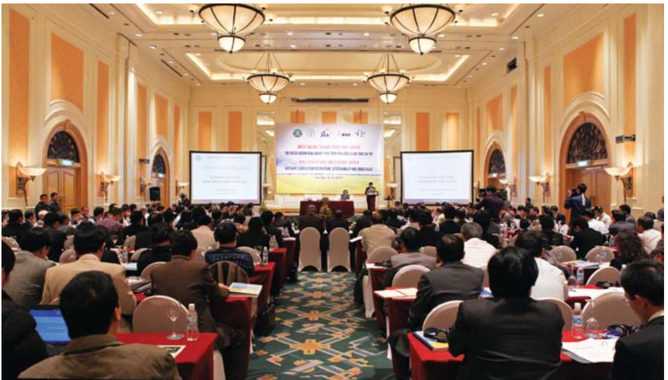
Hội nghị toàn thể ISG thường niên năm 2012 nhằm đối thoại định hướng tới ba trụ cột phát triển nông nghiệp nông thôn: Kinh tế - Xã hội - Môi trường

N gày 4/12/2012, Bộ Nông nghiệp và PTNT, Vụ Hợp tác Quốc tế thông qua Nhóm Hỗ trợ Quốc tế (ISG) với sự hỗ trợ của FAO, JICA, IFAD tổ chức Hội nghị toàn thể ISG thường niên năm 2012 tại Hà Nội với chủ đề: Tái cơ cấu ngành nông nghiệp