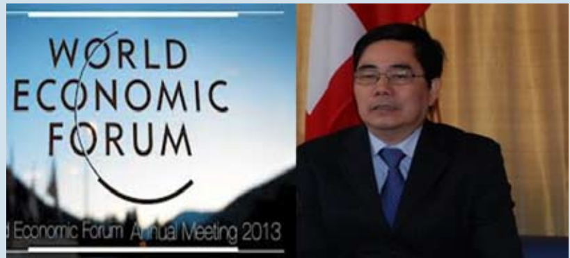
Bộ trưởng Cao Đức Phát trả lời phỏng vấn tại Davos, Thụy Sĩ

Bên cạnh việc thúc đẩy triển khai sáng kiến “Tầm nhìn mới