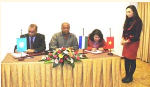
Lễ ký Biên bản Ghi nhớ ba bên về hợp tác Nam-Nam

Năm 2012, Châu Phi tiếp tục là địa bàn quan trọng trong hợp tác quốc tế về nông nghiệp của Việt Nam, do vậy Thủ tướng Chính phủ đã ký Quyết định ban hành Quy định về một số cơ chế, chính sách hợp tác nông nghiệp với các nước châu Phi giai đoạn 2012-2020, nhằm