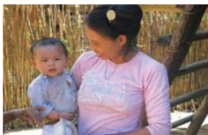
Phụ nữ nông thôn đóng một vai trò quan trọng đối với sự ấm no, hạnh phúc của gia đình, cộng đồng và cả nền kinh tế