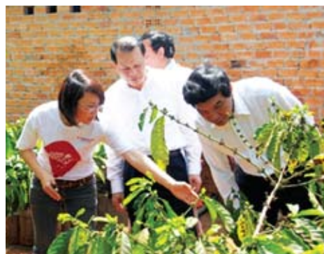
Phó Thủ tướng Vũ Văn Ninh thăm mô hình phát triển và phê bền vững của hộ dân xã Ea Tul, Đắc Lắc

huyện, xã. Trong triển khai thực hiện, công tác lãnh đạo, chỉ đạo cũng phải rất thực tế, không thể nóng vội nhằm sớm đạt chỉ tiêu. Nhân mạnh việc phải thường xuyên rà soát, xem xét lại quy hoạch, ngay cả khi đã được phê duyệt vì đây là công việc rất quan trọng, đặc biệt là quy hoạch sản xuất, quy hoạch sử dụng đất gắn với quy hoạch sản xuất, Phó Thủ tướng yêu cầu quy hoạch phải xuất phát từ đặc điểm tình hình ở địa phương, xã phải đưa ra được những yêu cầu cụ thể, người dân phải được góp ý đối với quy hoạch. (TH)