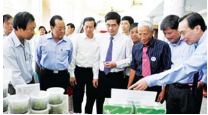
Bí thư Thành ủy TP HCM Lê Thanh Hải và Bộ trưởng NNPTNT Cao Đức Phát xem xét các sản phẩm nông nghiệp của nông dân các xã NTM của TP

Tại cuộc họp chỉ đạo triển khai thực hiện Chương trình mục tiêu quốc gia xây dựng nông thôn mới (CTMTQGXDNTM) của Bộ Nông nghiệp và PTNT ngày 16/4/2013, Bộ trưởng Cao Đức Phát yêu cầu các đơn vị cần nhận thức đầy đủ về nội dung, trách nhiệm của đơn vị đóng góp vào CTMTQGXDNTM, đồng thời phải nghiêm túc, khẩn trương, chủ động triển khai các nhiệm vụ được phân công. (Nội dung chi tiết tại thông báo số 1905/TB-BNN-VP ngày 16/4/2013).