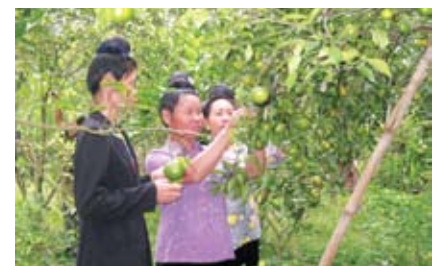
Nông dân xã Thanh Chăn học nghề kỹ thuật cam Vinh xen ổi.

Thực tế, tại 11 xã điểm vẫn còn hạn chế về cơ sở hạ tầng chưa hoàn thiện, chưa