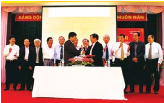
Ký kết Chương trình hợp tác giữa Hội Khoa học phát triển nông thôn Việt Nam và Cục Kinh tế hợp tác và PTNT giai đoạn 2013-2015 ngày 15/03/2013.

Thực hiện chương trình hợp tác giữa Hội Khoa học PTNT Việt Nam và Bộ Nông nghiệp và PTNT phê duyệt ngày 05/20/2012, Bộ trưởng Cao Đức Phát đã giao Cục Kinh tế hợp tác và PTNT làm đầu mối, phối hợp với Hội Khoa học PTNT Việt Nam triển khai các hoạt động liên quan đến phát triển nông thôn (Thông báo số 6404/TB-BNN-VP, ngày 24/12/2012). Hai bên cam kết