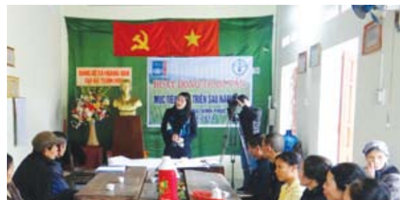
FAO tham vấn nhóm nông dân nghèo và dân bị mất đất về mục tiêu phát triển sau 2015 tại Vinh Phúc và Quảng Nam

Hiện chỉ còn không đến 1000 ngày nữa là hết thời hạn thực hiện MDGs, Tổng thư ký LHQ đã phát động tiến hành các cuộc tham vấn quốc gia, tiếp cận công chúng cởi mở về những nội dung thay thế cho các MDG khi năm 2015 qua đi. Với những thành tựu ấn tượng đạt được về các MDGs, Việt Nam được LHQ chọn tiến hành tham vấn quốc gia để lắng