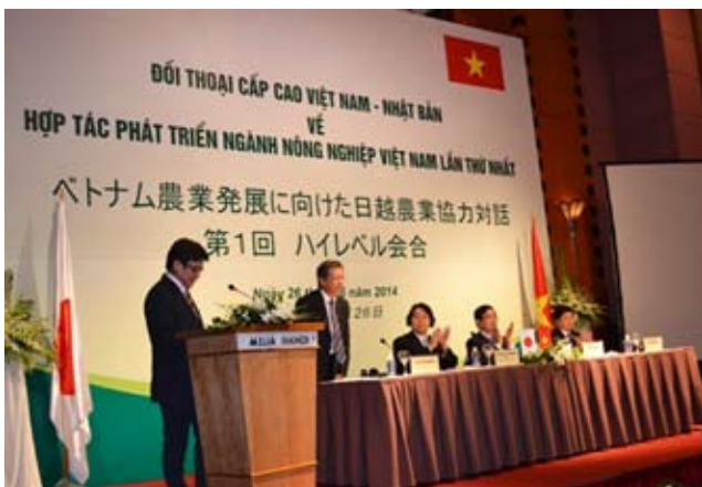
Hội nghị cấp cao Đối thoại hợp tác nông nghiệp Việt Nam-Nhật Bản lần thứ nhất tại Hà Nội, 26/6/2014

Hội nghị cấp cao Đối thoại hợp tác nông nghiệp Việt Nam-Nhật Bản lần thứ nhất đã thống nhất đề cương để hai bên cùng hợp tác xây dựng được Tầm nhìn trung và dài hạn cho phát triển ngành nông nghiệp Việt Nam một cách toàn diện giai đoạn 2015-2019. Theo Bộ trưởng Nông nghiệp và PTNT Cao Đức Phát, hợp tác nông nghiệp giữa hai bên sẽ tập trung nhiều vào hợp tác khoa học kỹ thuật, ứng dụng những công nghệ mới trong sản xuất nông nghiệp, công nghệ sinh học, chế biến và bảo quản sau thu hoạch; hợp tác nâng cao chuỗi giá trị sản xuất lương thực và thực phẩm, từ khâu sản xuất đến thu hoạch, chế biến, bảo quản, lưu thông phân phối sản phẩm thông qua sự đầu tư của các doanh nghiệp Nhật Bản và khung hợp tác liên kết phát triển kinh tế với sự tham gia của các cơ quan nhà nước và các doanh nghiệp tư nhân của cả hai nước.