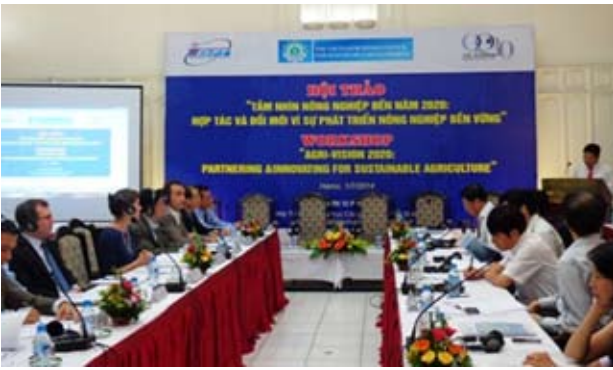
Hội thảo “Tâm nhìn nông nghiệp Việt Nam đến năm 2020: Hợp tác đổi mới vì sự phát triển nông nghiệp bền vững” tại Hà Nội, 1/7/2014

Tại Hội thảo đại diện Tập đoàn Monsanto nhận định, để tối đa hóa hiệu quả ứng dụng công nghệ cao trong nông nghiệp, Việt Nam cần xây dựng một lộ trình với nhiều giải pháp cụ thể để thúc đẩy hợp tác PPP trong ngành nông nghiệp. Tập đoàn Monsanto cam kết hợp tác với Việt Nam để hiện thực hóa tầm nhìn của quốc gia về phát triển nông nghiệp bền vững thông qua các sản phẩm, hoạt động và mối quan hệ hợp tác với các khu vực công và đối tác tư nhân. Tập đoàn Monsanto cho rằng, nâng cao chất lượng nông nghiệp sẽ giúp cải thiện đời sống người dân bằng cách sản xuất và bảo tồn hơn nữa để đạt mục tiêu phát triển nông nghiệp bền vững ở Việt Nam.