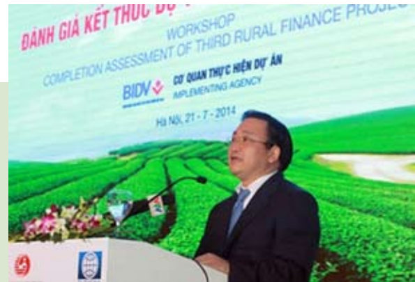
PTT Hoàng Trung Hải phát biểu tại hội thảo