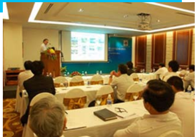
Chuyên gia Nhật giới thiệu thiết bị vệ sinh thủy sản cho ngư dân Việt Nam trong khuôn khổ Chương trình hợp tác kỹ thuật SANONE-JICA.

Mục tiêu của dự án SCIESAF là giúp bổ sung trang thiết